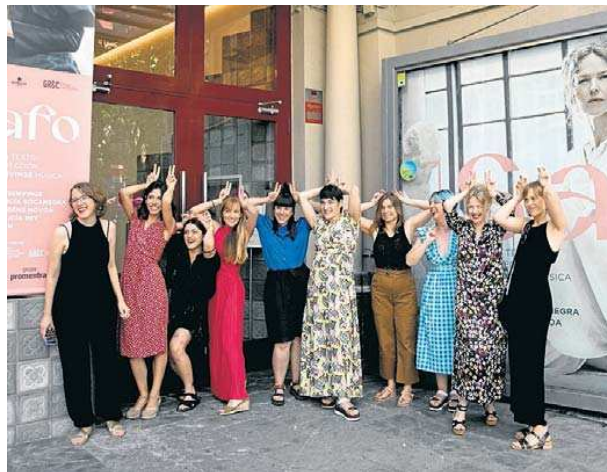
L'equip de Safo al davant del Teatre Romea.