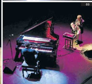
01. La proposta d'Animal Religion a la fira. 02. Espectacle inaugural de Kukai Dantza. 03. El concert de Chano Domínguez i Paolo Fresu.