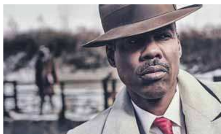
Chris Rock és el cap d'una família de gàngsters

Notícia distribuïda per a l'Institut del Teatre