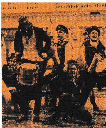
Emorió, de Sound de Secà

Una de les decepcions de l'estiu passat va ser la suspensió forçosa de l'Esbaïola't, el festival de les Valls d'Àneu, que s'havia de celebrar a mitjan juliol a Esterri d'Àneu. L'organització, que depèn de La Baldufa i l'Ajuntament d'Esterri, ha decidit reformular el festival per tal que hi hagi un fil de continuïtat i celebrar-lo durant quatre caps de setmana de tardor. La reformulació de l'Esbaïola't ha passat per eliminar la participació de companyies internacionals, distribuir l'activitat al llarg de quatre mesos —habitualment la mostra es concentra en quatre dies consecutius— i la inclusió d'activitats paral·leles. Els mesos de setembre (dies 26 i 27), octubre (del 22 al 25), novembre (dies 27 i 28) i desembre (dies 19 i 20) actuaran a Esterri les companyies Anna Confetti ( A la fresca ), Sound de Secà ( Emorió ), Campi Qui Pugui ( Camí a l'escola ), Zum Zum Teatre ( La gallina dels ous d'or i Gretel i Hansel ) i La Baldufa ( Mon pare és un ogre i La faula de l'esquirol ). Aquests espectacles s'intercalen amb tallers de moviment, de teatre per a joves o d'improvisació. Aquest és el pont que ha de vincular l'Esbaïola't d'enguany amb el del proper estiu ( www.festivalessbaiolat.cat ).