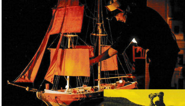
L'odissea de Latung La La, de David Ymbernon